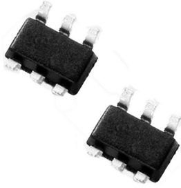
图3. 来自Littelfuse的SDP偏压系列SOT23-6

如需有关本产品的更多信息，包括详细规格、浪涌额定值、包装选择等，请参考Littelfuse网站上提供的数据表。